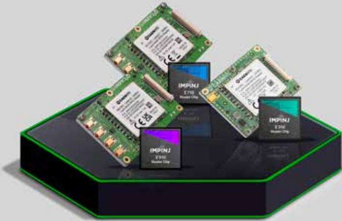
CAEN RFID Lepton X

La serie Lepton3, a basso consumo e medie prestazioni, è basata sul chip Impinj E310, la serie Lepton7, adatta ad applicazioni di alte prestazioni, è basata sul chip E710 mentre la serie Lepton9, ad altissime prestazioni, è basata sul nuovissimo chip E910.