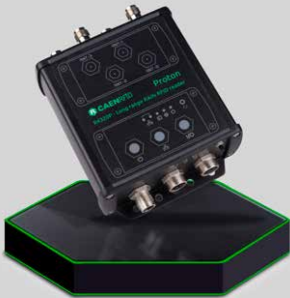
CAEN RFID Proton