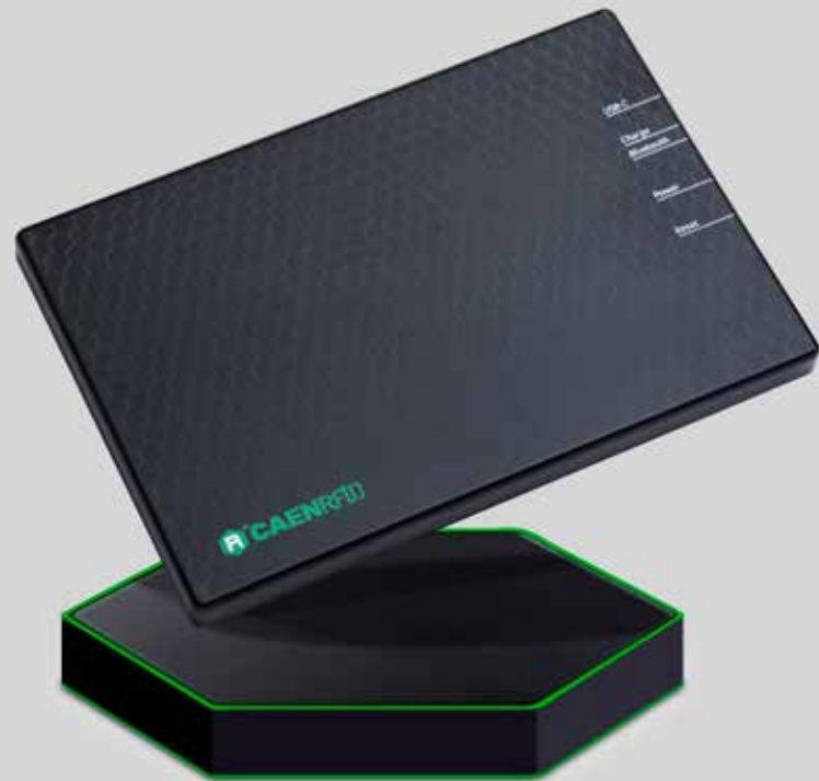
CAEN RFID trID

CAEN RFID Proton è la scelta ideale per l'automazione industriale e le soluzioni Industry 4.0. Il Proton è un lettore robusto con una form factor compatta (L131 × L106 × H50 mm3) che può essere alimentato da una batteria a 12 o 24 volt. Queste caratteristiche rendono il Proton adatto ad applicazioni di monitoraggio su veicoli, in particolare su veicoli industriali come carrelli elevatori, camion o AGV.